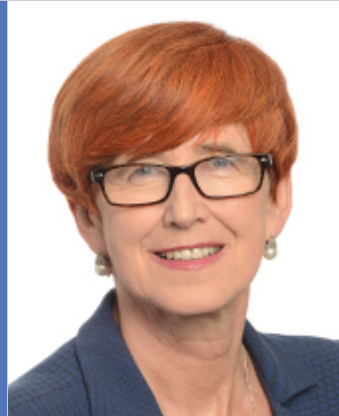
Mme RAFALSKA Elzbieta (PL, PL)