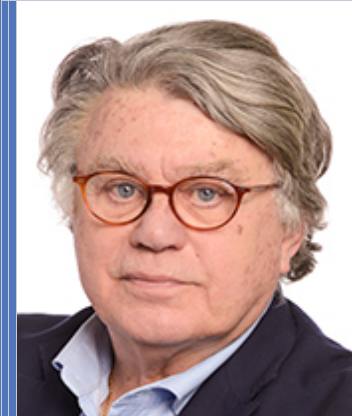
M. COLLARD Gilbert (FR, FR)