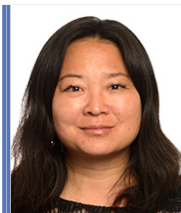
Mme POLFJÄRD Jessica (SE, SV)