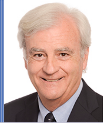
M. RINALDI Antonio Maria (IT, IT)