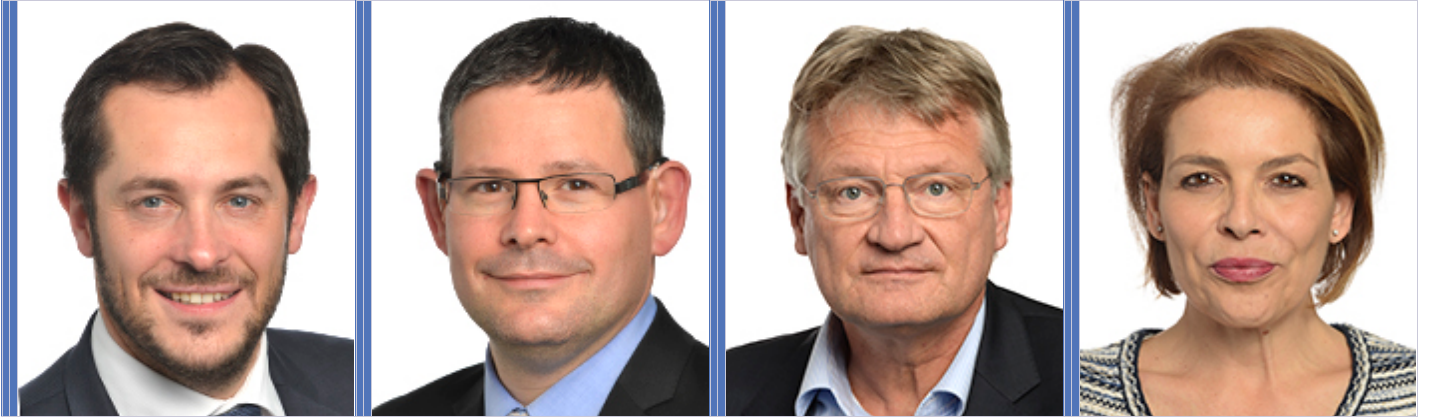
M. BAY Nicolas (FR, FR)