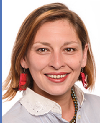
Mme JÁRÓKA Livia (HU, HU)